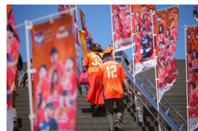
参考：2023-24シーズン デザイン

全体サイズ：高さ180cm × 横幅60cm | 広告スペース：高さ20cm × 横幅60cm