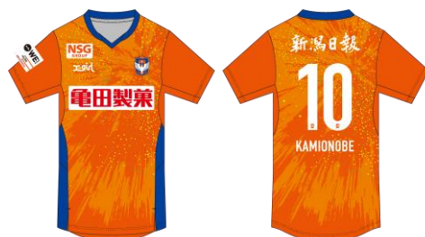
参考：2023-24シーズン デザイン