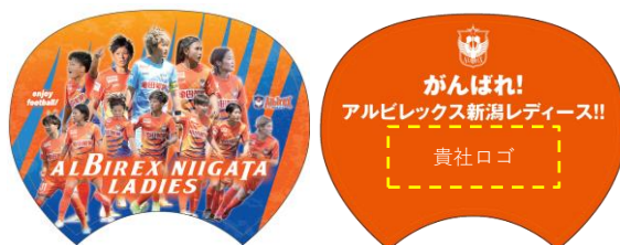
参考：2023-24シーズン デザイン