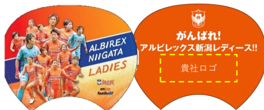
参考: 2022年夏製作 デザイン