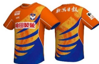
参考: 2022-23シーズン デザイン